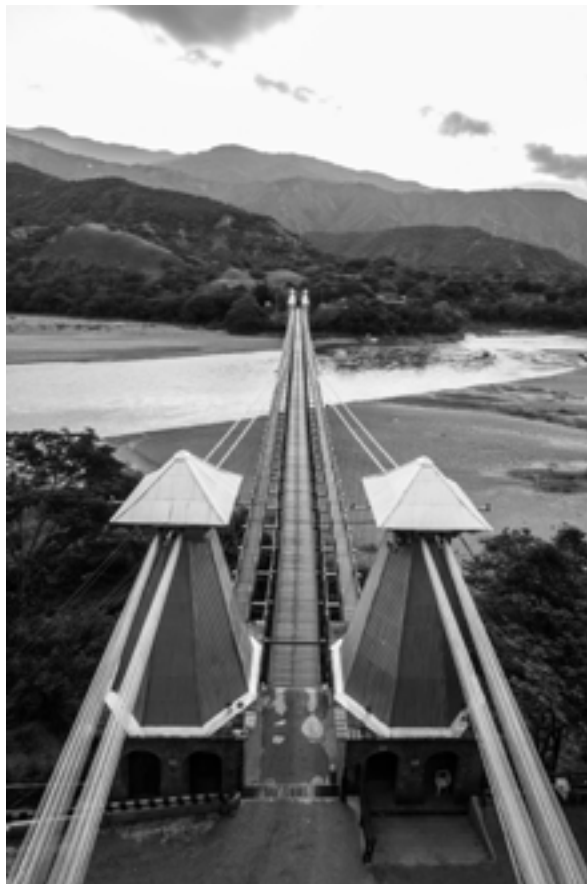
Título: Hombre, intervención, humanidad.

Como contador de historias siempre es muy intrigante observar cómo interactúa el hombre consigo mismo y con la naturaleza, retratar sus rastros de progreso reflejados en monumentales obras que siempre tienen algo que decirnos, y que como en la vida, todo depende de la perspectiva que le pongas a las cosas.