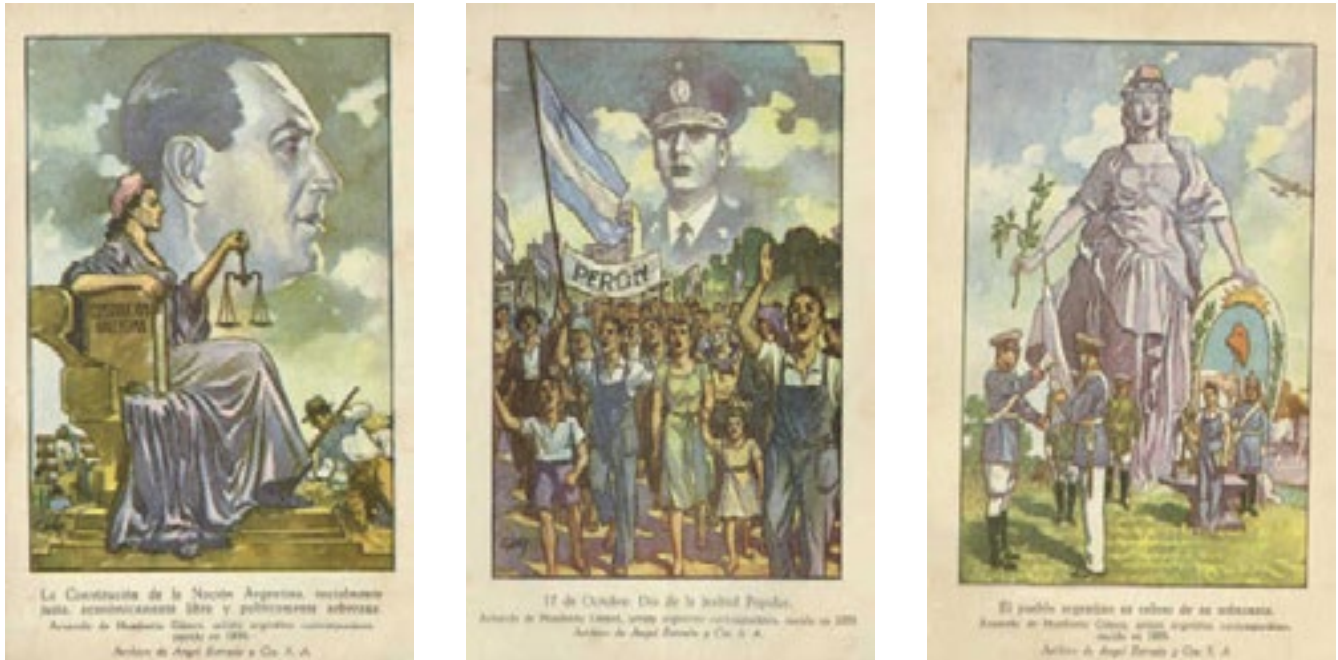
Figura 1. Propaganda peronista, donde se muestra la figura del caudillo como encarnación del sentir popular.